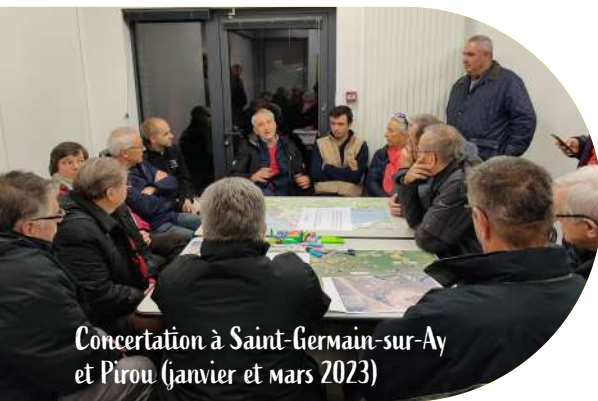
Concertation à Saint-Germain-sur-Ay et Pirou (janvier et mars 2023)