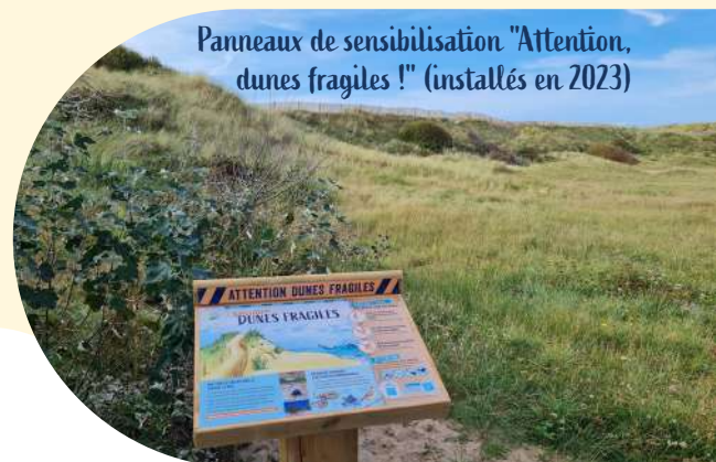
Panneaux de sensibilisation "Attention, dunes fragiles !" (installés en 2023)