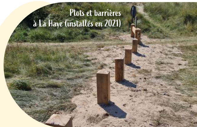
Plots et barrières à La Haye (installés en 2021)