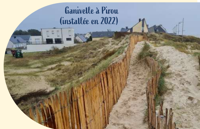
Ganivelle à Pirou (installée en 2022)